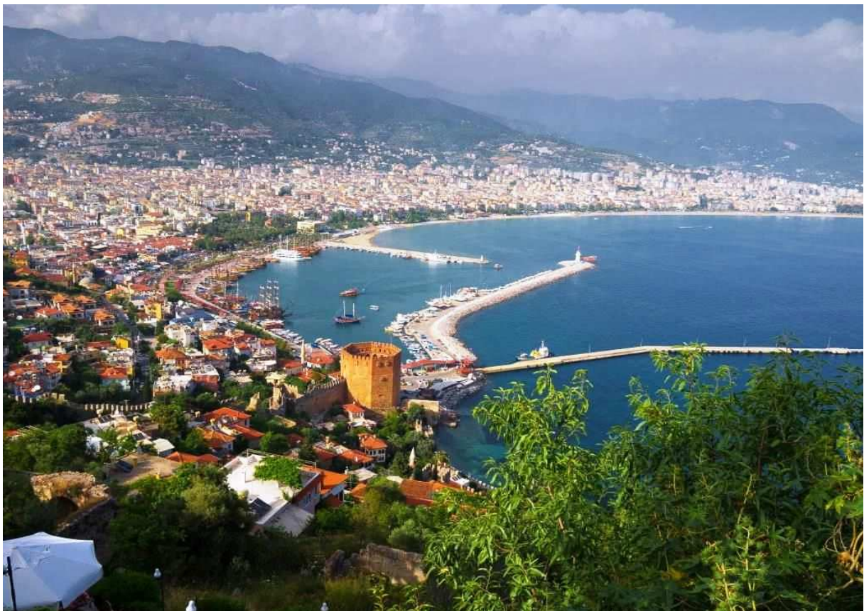
Foto: Alanya, türkische Riviera.

Investieren Sie deshalb in barrierefreie/rollstuhlgerechte Wohnungen an der türkischen Riviera. Investieren Sie dort, wo andere und bald auch Sie Urlaub machen.