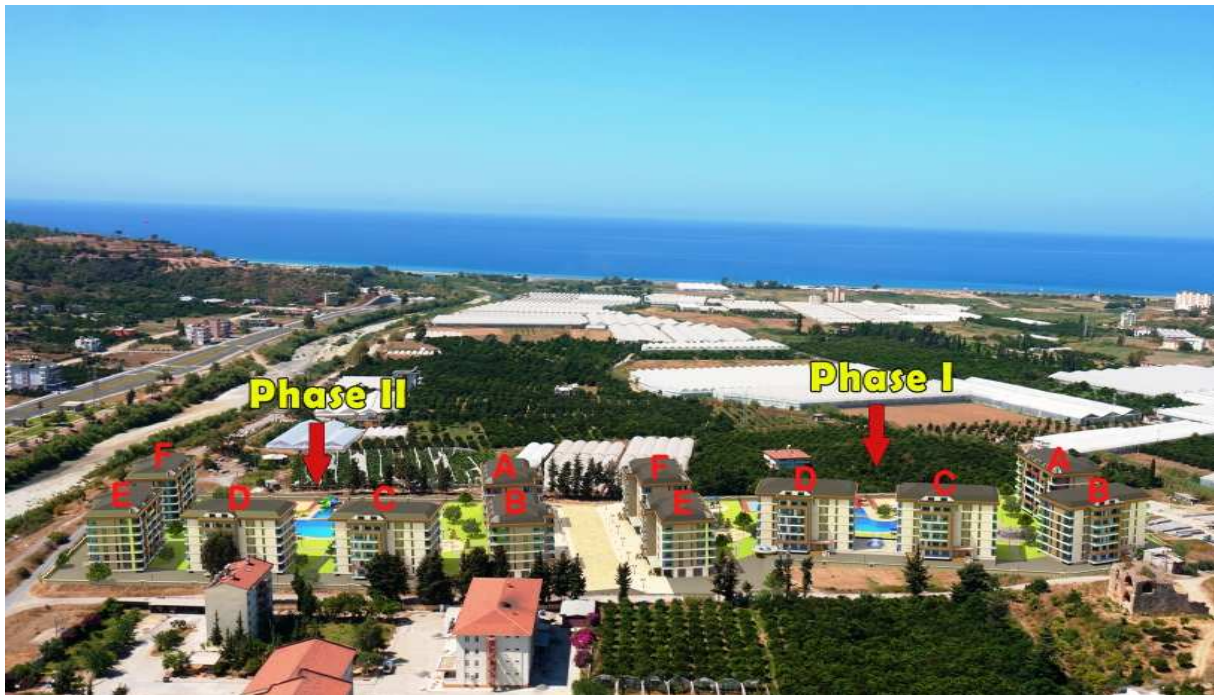
Fotoanimation: Fortuna Resort in Demirtas.

Nur mit Absicherung über eine deutsche Immobilie empfohlen.